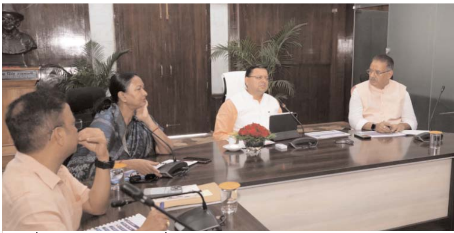
कृषि और उद्यान विभाग की समीक्षा बैठक लेते सीएम।

वीर अर्जुन संवाददाता देहरादून, । मुख्यमंत्री पुष्कर सिंह धामी ने मंगलवार को सचिवालय में कृषि और उद्यान विभाग की समीक्षा के दौरान अधिकारियों को निर्देश दिये कि राज्य में किसानों को आर्थिकों की ओर तेजी से बढ़ाने की दिशा में प्रभावी प्रयास किये जाएं। यह सुनिश्चित किया जाए कि किसानों को विभिन्न योजनाओं का लाभ एक पैकेज के रूप में मिले। केंद्र और राज्य सरकार द्वारा किसानों के हित में चलाई जा रही विभिन्न योजनाओं का पूरा लाभ किसानों को मिले इसके लिए राज्य और जनपद स्तर पर कार्यक्रम आयोजित किये जाएं। मुख्यमंत्री ने बैठक में अधिकारियों को निर्देश दिये कि पॉलीहाउस के निर्माण में तेजी लाई जाए। उन्होंने कहा कि किसानों की आय बढ़ाने और स्वरोजगार को बढ़ावा देने के लिए पॉलीहाउस योजना सहायक सिद्ध होगी, इनके निर्माण में लेटलतीपी करने वाले अधिकारियों को जिम्मेदारी तय की जायेगी। मुख्यमंत्री ने कहा कि